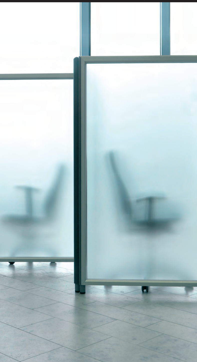
SILENCE LINE Raum.Gliederung.System

Mehr Effizienz durch bessere Arbeitsbedingungen – das ist Ziel und gleichzeitig Lösungsansatz für unsere Dienstleistungen und Produkte. Wir beraten, planen, entwickeln und produzieren flexible Raumgliederungssysteme für Büros, Großraumbüros, Call-Center, Einzel- und Gruppenarbeitsplätze sowie Besprechungsbereiche. Unsere Kernkompetenz liegt im Bereich der individuellen und ganzheitlichen Akustiklösungen.