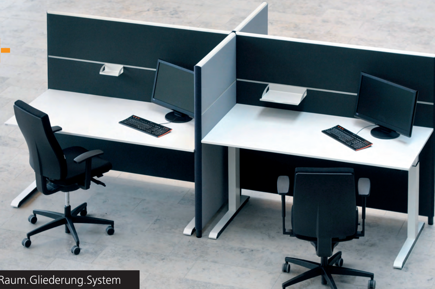
SILENCE LINE Raum.Gliederung.System