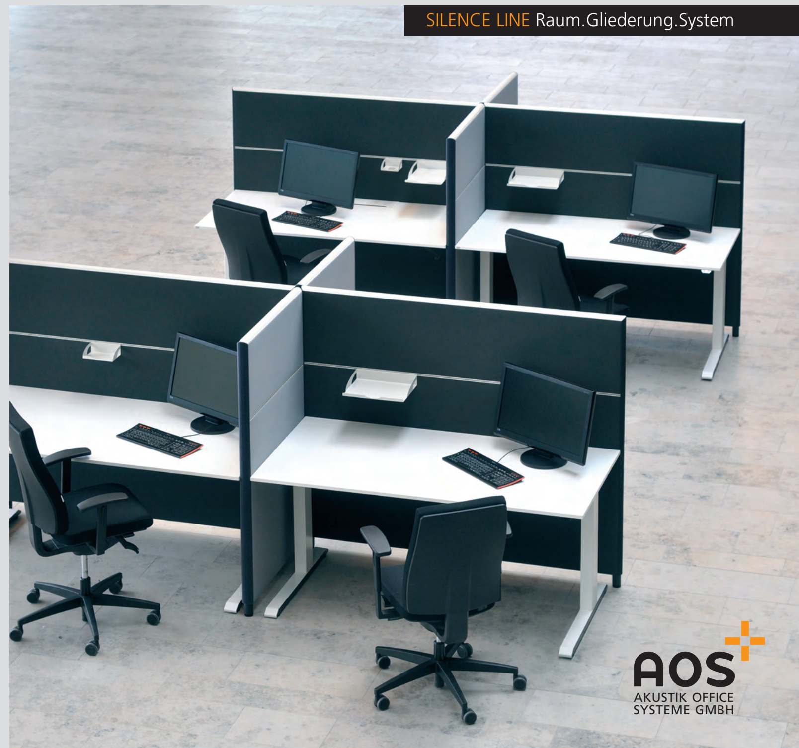
SILENCE LINE Raum.Gliederung.System

AOS Akustik Office Systeme GmbH Lenabergweg 5 91626 Schopfloch Telefon 09857 975210 Telefon 09857 975211 Telefax 09857 975212 info@akustik-office-systeme.de www.akustik-office-systeme.de